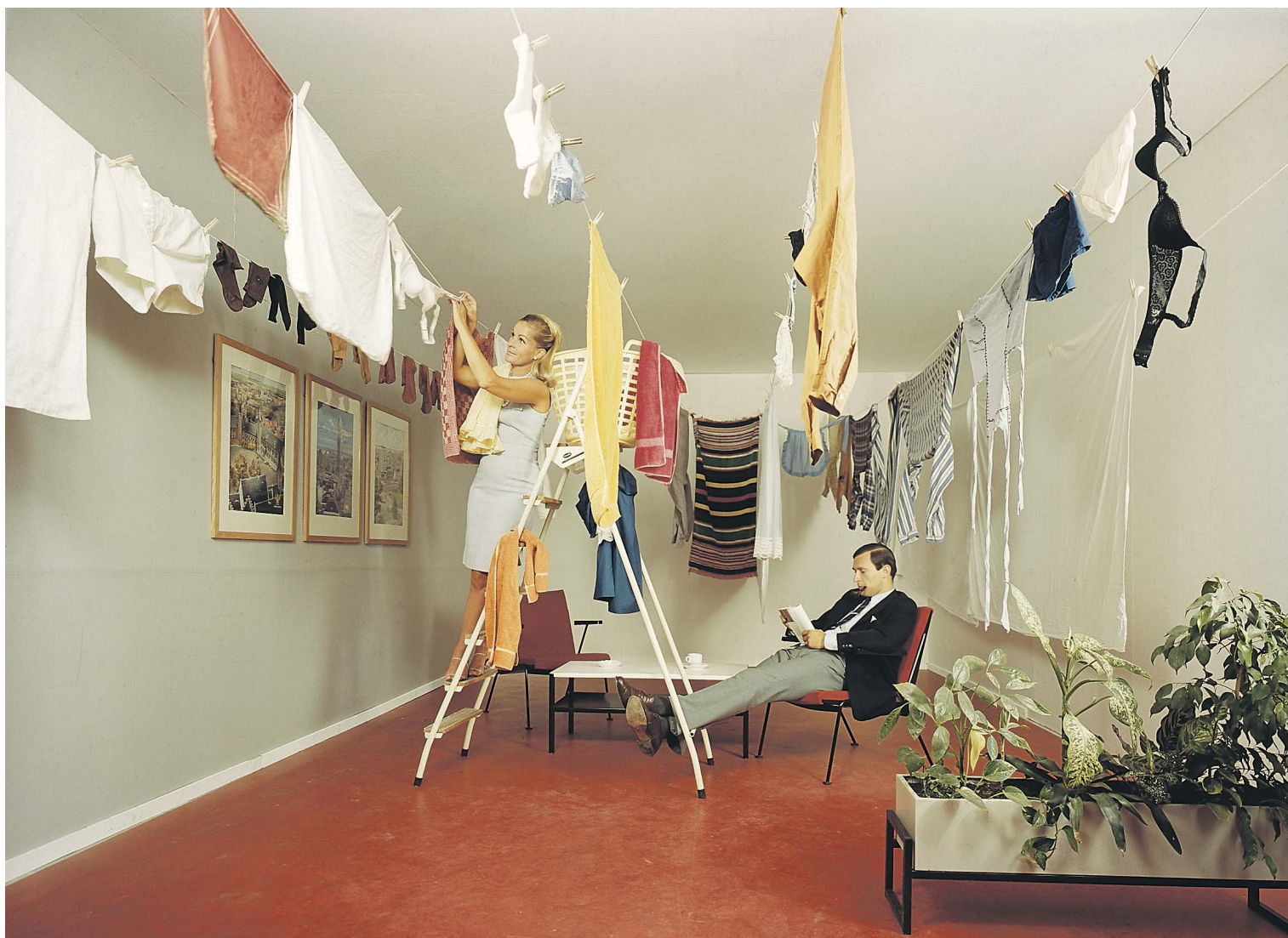
Nederlands echtpaar in 1968. Zij hangt de was op, hij rookt een pijpje.